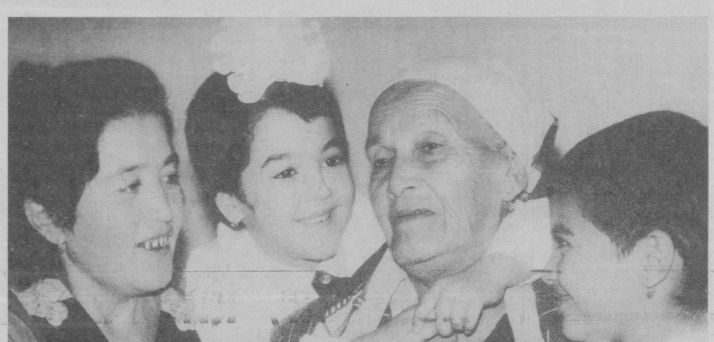
Қариси бор уйнинг зари бор.

этибор қаратилмоқда. 12 июнда ўтказилган «Тошкент опен» Халқаро теннис мусобақаларида 20 нафар раҳбар аёллар иштирок этдилар.