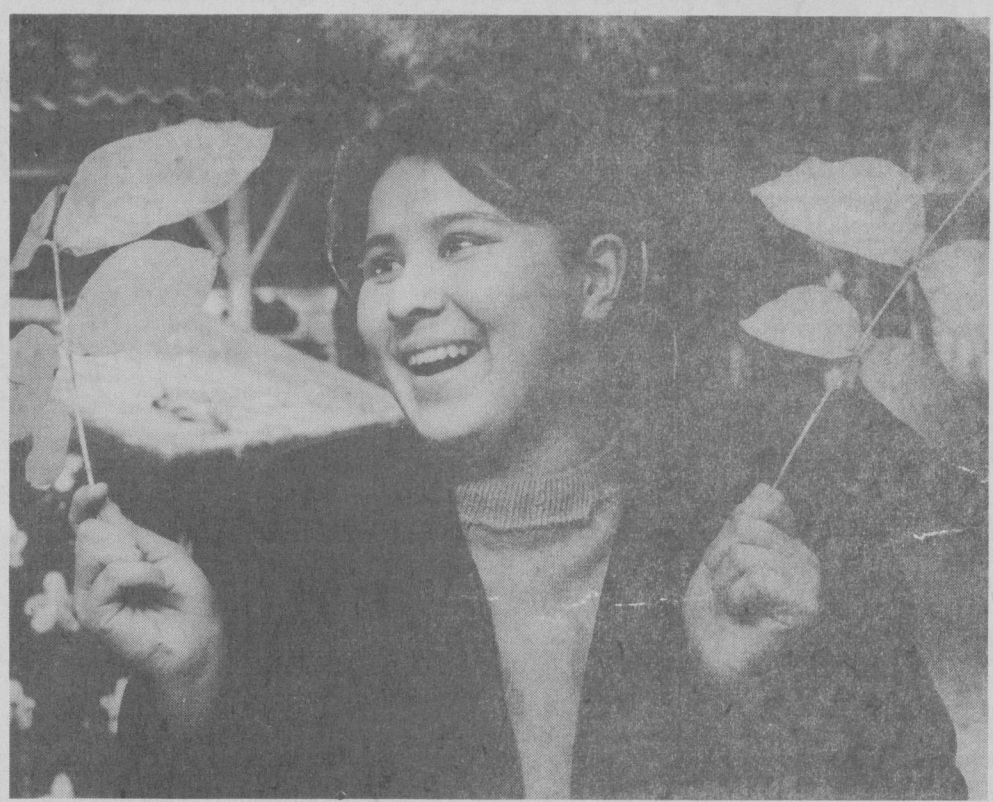
Табиатга ошно қалб.

Шунингдек бу йил маҳаллада ишга туширилган соғломлаштириш мажмуаси ёшларнинг севишли масканига айланди. Икки қаватли бинода ташкил топган ўшбу мажмуада чўмилиш ҳавзаси, машғулотлар ўтказиш хонаси, икита теннис корти, волейбол, баскетбол, футбол майдонлари ёшлар фитнессига топши-