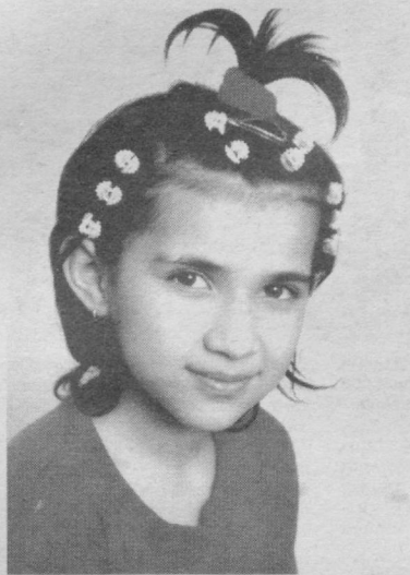
Шу оғод ва обод Ватанинг бахтиёр ёшларимиз...

Англиялик бир группа денгиз сайёҳлари ва тилшунослар кемалар ўртасида, порт хизматчилари билан суҳбат олиб боришда ҳамда авария вақтида алоқа боғлаш учун ягона "денгиз тили"ни жорий этишни таклиф қилдилар. Бунда бир неча ўзига хос "халқаро" ибора қўшилган содда-лашган инглиз тили асос қилиб олинди. Бирлашган Миллатлар Ташкилоти раҳбарлигида иш олиб борувчи Халқаро денгиз ташкилоти орқали тавсия этилган "денгизда сўзлашув китоби"да шундай лўнда иборалар борки, улар билан денгизда сузиш, портларда маневр қилиш ва бошқа ишларни бажариш пайтида вужудга келувчи ўттиз олтига вазиятни ўзаро тўла тушуниб олиш мумкин. Шуниси қизиқки, денгиз сўзлашув китобининг муаллифлари денгиздаги тўқнашувлар аксарият ҳолларда инглиз тилида гаплашадиган кема экипажларининг йўл кўйган хатолари сабабли вужудга келар экан, деб айтишмоқда. Ана шу кемалардан келаётган радиогаммаларнинг тилга боиллиги қабул қилувчини янглиштириб юборади.