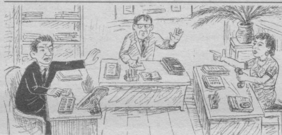
— Йўқ деворинг!

— Қайси от биринчи бўлиб келса, ўшагага тикиш керак, — деб маслаҳат берди ёзувчи.