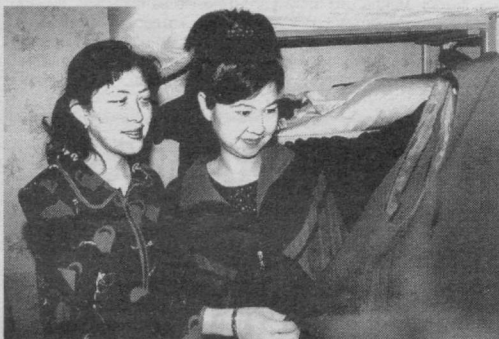
Мижозларни намунали хизматлари билан мамнун этаётган «Малика модел» масъулияти чекланган жамияти чеварлари сифатга муҳим аҳамият қаратишадди.

● Тошкент шаҳар ҳокимлиги Матбуот хизмати ва ўз мухбирларимиз хабарларидан.