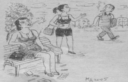
— Яхши йигит битта чектириб кетинг, сигаретим тамом бўлиб қолди. Абдурасул Ҳақимов чизган расм.

Бир киши қадрдон дўстларидан бирига илтимос қилди. — Дўстим, менга 20 минг сўм қарз бериб туролмайсанми? — Йўқ, беролмайман, — деди дўсти қатъий.