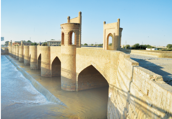
Қарши шаҳридаги кўна Қашқадарё кўприғи ўз замонасида йирик архитектура иншоотларидан бири бўлганиги қадимий манбаларда қайд этилган. У неча-неча асрлар давомида нафақат аҳоли ва карвонлар манзилини яқин қилган, балки шаҳар мудофасини таъминлашда ҳам стратегик аҳамият касб этган. Ушбу кўприкнинг ўзига хос тарихи бор.