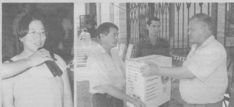
2005 — Сихат-саломатлик йили

ҳуқуқбузарликлари учун молиявий жавобгарлигини эркинлаштириш тўғрисида"ги Фармони катта мамнуният билан кутиб олди. Унда ҳўжалик юритувчи субъектларнинг ҳуқуқлари ва қонуний манфаатларини ҳимоя қилиш тизимини янада такомиллаштириш, тadbиркорлик фаолиятини амалга ошириш учун қулай ҳуқуқий ва иқтисодий шарт-шароитларни шакллантириш мақсадида, шунингдек жавобгарликни қўллашнинг халқаро умумҳуқуқий принципларидан келиб чиққан ҳолда "Тadbиркорлик субъектлари томонидан биринчи марта содир этилган, қасддан қилинмаган ва кам аҳамиятли, шунингдек Давлат бюджети ва давлат мақсадли жамғармаларига тўловлар камроқ тушишига олиб келмайдиган ҳуқуқбузарликлар учун мансабдор шахсларга нисбатан қонунда белгиланган тартибда материалларни суд органларига тақдим этмасдан, фақат маъмурий жавобгарлик чоралари қўлланилади", дейилганлиги юртимизда қонун қафолати борлигидан далolatдир. Фармонлардан текиширишлар мутлақо таъкидлаб қўйилади, деган фикр келиб чиқмаслиги керак, албатта. Бироқ ҳаммаси қонун доирасида амалга ошганига нима етсин! Шундай соғлом муҳит, шундай эркин тadbиркорлик бизни кўзлаган ойдin манзилларимизга олиб боришига тўла ишонаман!