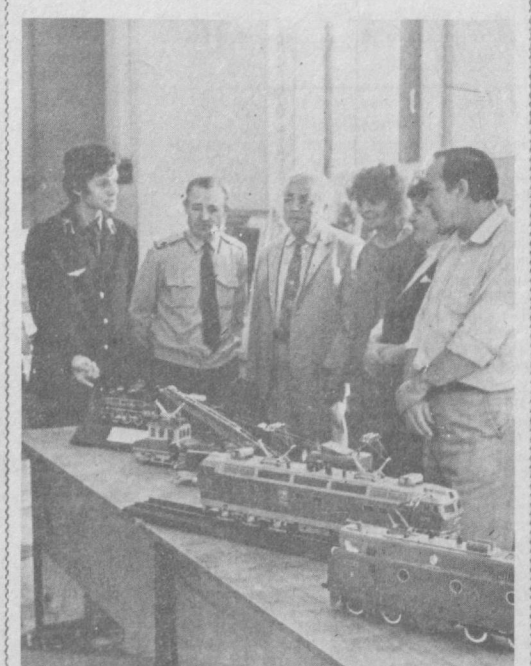
Тарихий қайта тузилиш шaroитларида иқтисодий беллашувининг самарадорлиги — темирйўлчидаги тармон илгор тажриба мактабиде бўлиб ўтган машғулотларнинг мазмун аниқ шундай бўлди. Унда мамлакатимиз кўпгина меҳнат жамояларининг вакиллари иштирок этишди. Машғулот қатнашчилари амалий беллашувларнинг шакллари, уни ривожлантириш йўллари борасидаги ўз мулоҳазалари билан ўртоқлашди, ушбу муаммо Урта Осиё темир йўлида қандай ҳал этилаётгани билан танишишди. Сўрагач: машғулот қатнашчилар тармоқ илгор тажриба мактабиде Тошкент болалар темир йўли тўғраги қатнашчилари асаган экспонатлар билан танишишмоқда.

жумҳуриятимиз билан савдо ишларини олиб бормоқда. Ана шу йиллар давомида улар 500 миллион долларга 400 минг тонна пахта толасини сотиб олишди. Жумҳуриятимиз эса японияликлар ёрдамида қишлоқ хўжалиги, турли сонаот учун янги техникалар харид қилди. Кўргазмада «Тойто» автобусидан тортиб деҳқончилик учун зарур бўлган—экиданг, сугорадиган техникалар, мева ташийдиган машиналар, турли хил кранлар, бульдозер ва митти экскаваторлар ўрни олиб бораётган савдо-сотиқ ҳамжи бир йилда ўрта ҳисобда 700 миллион долларни ташкил этиди. Кўргазма қамшоҳарларимизда катта тасвурот қолдирди.