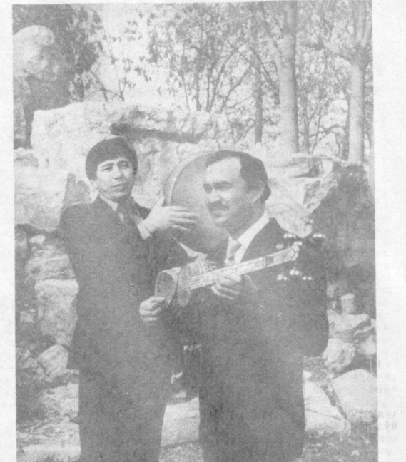
Ҳозир Исмоилжон санъатнинг айти гуллаган даври. У айна иқидиқ инлиши. Мақсадлари аниқ, режалари катта: шоирларнинг замонавий шеърлари билан айтадиган янги-янги қўшиқларни ўрганиш билан машғул. Оилада эса у фарзанднинг меҳрибон отаси. Турмуш ўртоғи — ҳушовоз хонанда