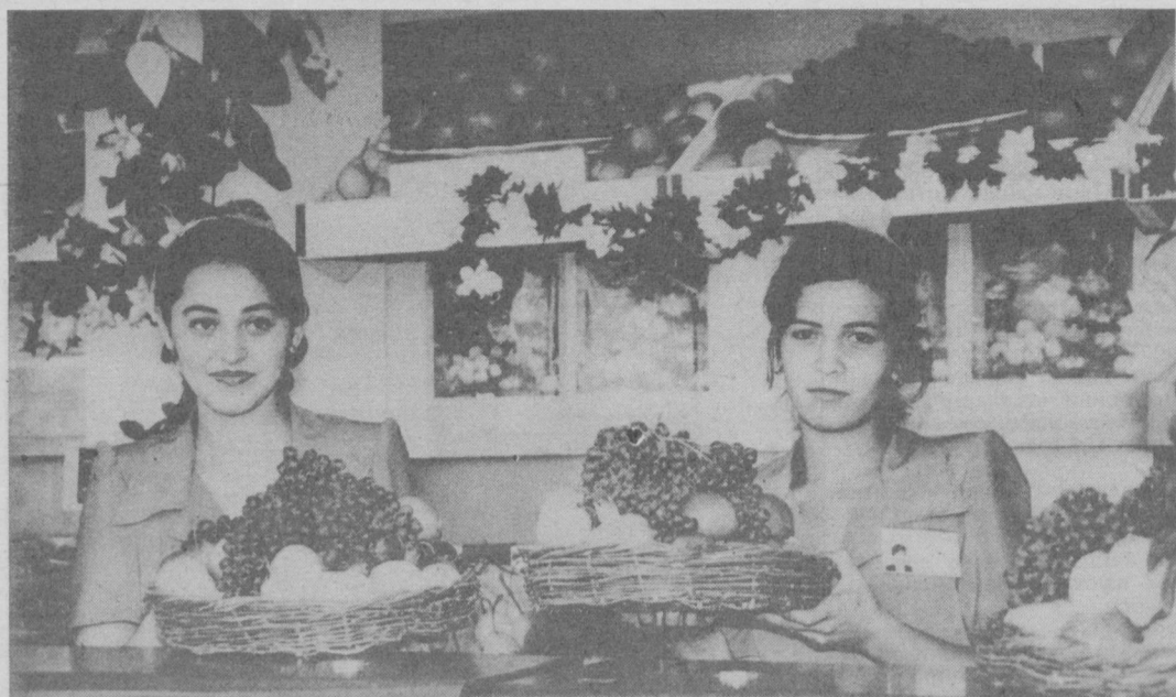
Ноъ-неъматлар — дастурхонимиз беағи.