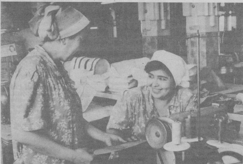
«Орзу» ҳиссадорлик жамияти чеварлари тикаётган бежирим ва чиройли маҳсулотлар хариддорларга манзур бўлмоқда. Янги ўқув йилида уларнинг фарзандларимиз учун тайёрлаган ўқувчилар сумкалари кўпчиликни хушнуд этди.