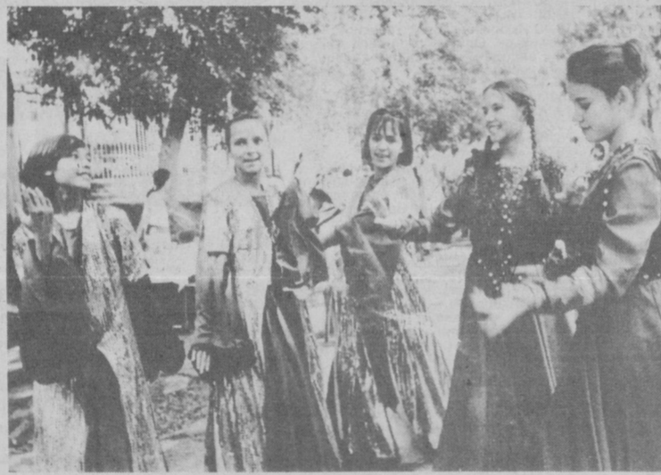
СУРАТЛАРДА: 21-Меҳрибонлик уйида ўтказилган тadbirdан лавҳалар.