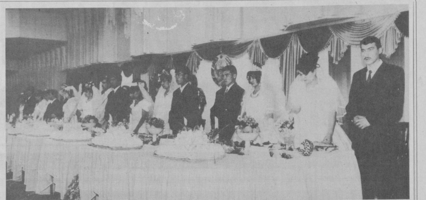
ЎЗБЕКИСТОН РЕСПУБЛИКАСИ МУСТАҚИЛЛИГИНИНГ 8 ЙИЛЛИГИ ВА АЁЛЛАР ЙИЛИДА ЯНГИ ОИЛА ҚУРАЁТГАН КЕЛИН-КУЁВЛАРНИНГ МАМЛАКАТИМИЗ ЙИГИТ-ҚИЗЛАРИГА

Зиёдулла соҳиб тўрт йил давомида Покистондаги Каро-чи металлургия заводига тар-жимон бўлиб ишлаган. Шу туфайли бўлса керак, Поки-