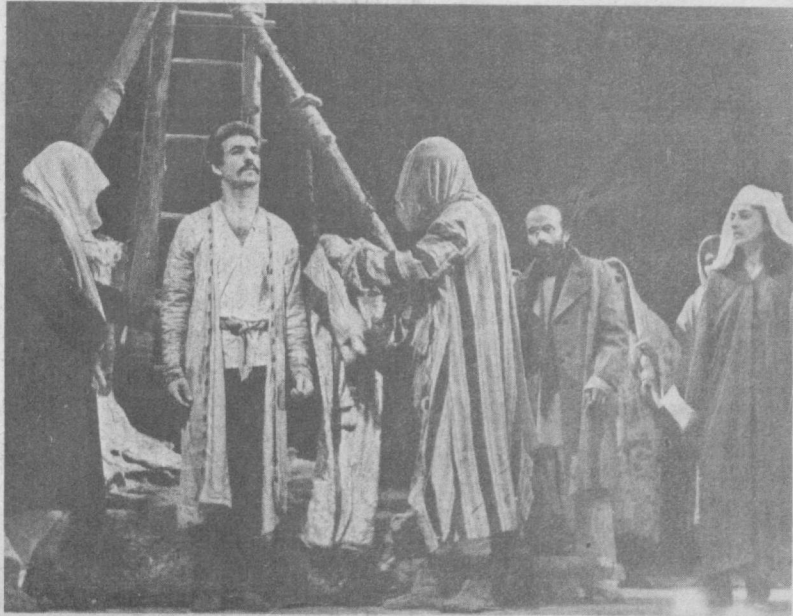
● Урта Осие ва Қозоғистон жумҳуриятлари театрларининг аънаввий III худудий фестивали Тожикистон жумҳуриятининг Душанбе шаҳрида кун кеча якуниланди. «Наврўз — 90» деб номланган ушбу анжуман ҳақиқий театр байрамига айланиб кетди. Унда Урта Осие ва Қозоғистон театрлари ўзларининг энг kuchли сўзлар билан катнашдилар. Жуда катта тавбегарлик кўрилган ушбу кўрикде зўр ижодий руҳ ҳукм сурди. Кўплаб янги иштироқлар кашф этилди.

МАНСУР Халлоҷ ва Насимийлар сингари ҳурфидар асарлари ҳамда феодад даври ҳукмрон мафкурасига ўта зид дунёқароши учун қурбон бўлган оташини ўзбек шоири Бобораҳим Машраб номи, адабий мероси халқимиз қалбидан мустаҳкам жой олган.