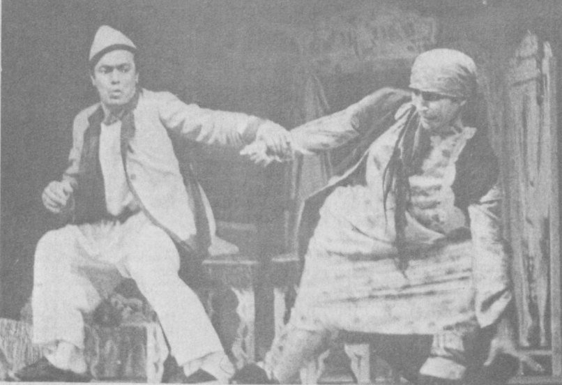
Санъатнинг сеҳрли олами

Беш кунлик дунё бу—деганлари рост, Билман ишадимми ё мушкул ўтдим, Йашини истардим одамларга хос, Уйримни емирди айрилик ўти. Мирза КАРИМ.