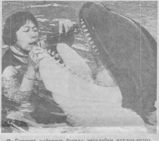
○ Гонконг ҳайвонот боғида эрталабки пардоз-андоз.

○ ПРАГА. Бу ерда ишил фуражга кийган ҳарбий хизматчилар — чегарачи соқчилар пайдо бўлди. Улар Чехословакия милицияси вакиллари билан бирга тартибни сақлаш, қонунбузарликнинг олдини олиш хизматини бажармоқдалар.