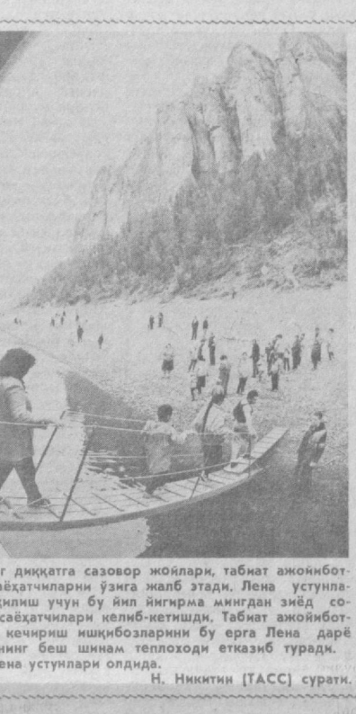
Ўқиткисининг диққатга сазовор жойлари, табат ажоннот-лари кўллаб сайҳатчиларни ўзига жалб этади. Лена устун-ларни томоша қилиш учун бу йил йнгрима мингдан зиёд со-вет ва чет эл сайҳатчилари келиб-кеттиди. Табат ажоннот-ларини кўздан кешириш иқтибозларини ерга Лена дарё парохидлигининг беш шимна теплохоби етказиб туради. СУРАТДА: Лена устунлари олдига.

қучур муҳаббат уйғотишимиз керак. Масалан, Аббор ака Ҳидоятовни олай-лик. 1941 йилда «Отелло» спектаклида ролни шундай маҳорат билан қўйламо-қон қилиб ўйнаваларки, ҳатто эртасига ишга кетаётганларида одамлар ана, Отелло, кетайми деб дейишган. Уларни ҳам бунинг эшитиб ҳафс хурсанд бўлган эканлар. Демокриманки, биздан «Кас-бингиз нима?» — деб сўрашмасин, муаллимимиз чехраимиздан сезилиб турсин. Ўқувчиларга меҳримиз покиза қалбимиз, орасталигимизда қуринсин. Бизни кўрган ҳар бир инсон: «Ҳа, бу муаллим экан», — деб тўғри тасаввур қилсин. Дил билан қийинчилигимиз, ўзи-мизга ярашган либосимиз, қадам бо-шини, катта-ю кичкинни бирдек ҳурмат қилишимиз улғу касб эгаси эканлиги-миздан долатол берсин.