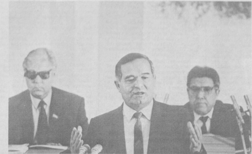
СУРАТЛАРДА: Ўзбекистон ССЖ Олий Кенгашининг мажлисидан лавҳалар.

Совет 17 да фаол муҳофиза воситалари ёрдамида гаровдагилар озод қилинди. Икки жиноятчи ўлдирилди, қолганлари турли даражада жараҳатланди.