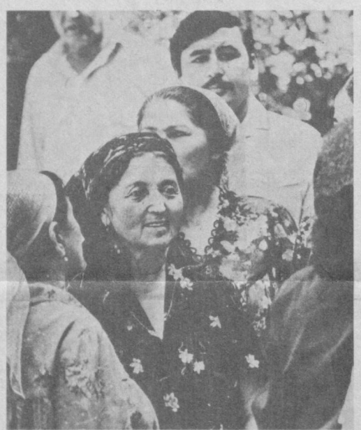
Она бўлмаганда қаерда байрач.