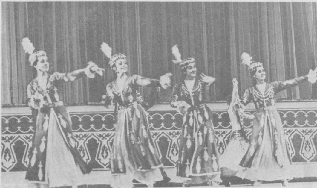
Шодлик бир зум сизни қилмайди қанда, «Лазги»нинг қизлари рақс тушганда!