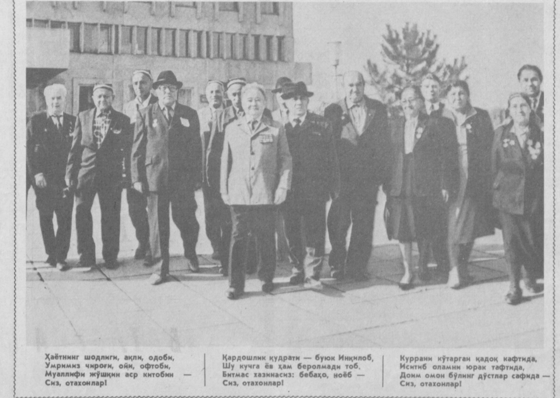
Ҳаётнинг шодлиги, ақли, одобни, Умригаз чироғи, оғи, офтоби, Муаллими ўшқини аср китобини Сиз, отахонлар!