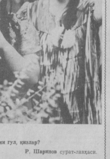
Гулли гул ё сизми гул, қизлар? Р. Шарипов сурат-лавҳаси.