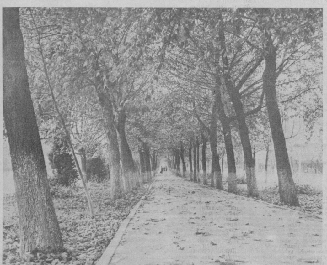
«Кўз шамолда шовулган дарахлар...»