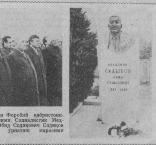
© КЕЧА пойтахтимиздаги Форобий қабристонда атоқли совет кимёгар олим, Социалистик Меҳнат Қаҳрамини, академик Обид Солиқович Солиқов қабрига унинг ёдгорлигини ўрнатилиш маросими бўлиб ўтди.

Бюро мажлисида шаҳар партия ташкилоти фаолиятига доир бошқа масалалар ҳам кўриб чиқилди.