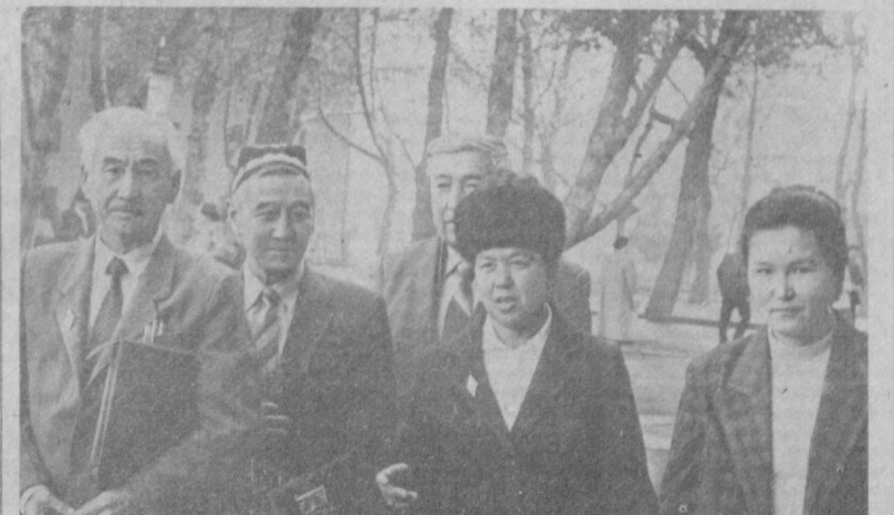
СУРАТДА: жумҳурият ўқитувчилари анжумани қатнашчиларидан бир гуруҳи.