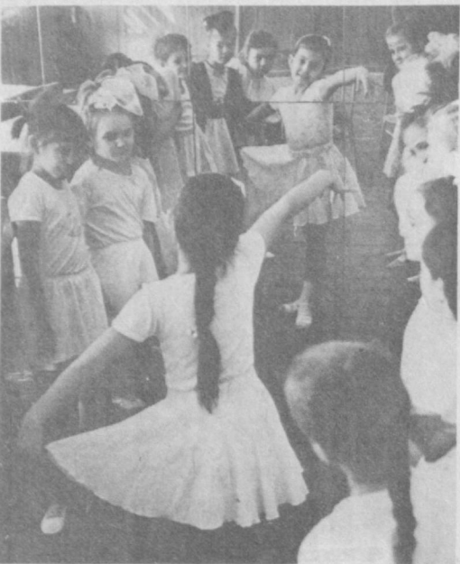
© ЕШ РАҚОСАЛАР. Р. Альбеков сурат-лавшаси.