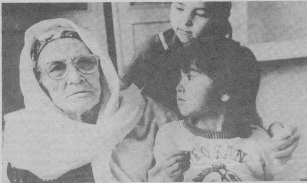
Ўригидан данаги ширин