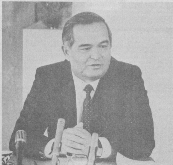
СУРАТДА: Ўзбекистон ССЖ Президенти И. А. Қаримов саволларга жавоб қайтармоқда.

21 ноябрь кuni Ўзбекистон ССЖ Президенти И. А. Қаримов жумҳурият ва Бутуниттифоқ оммавий ахборот воситаларининг вакиллари билан учрашди. Учрашув Ўзбекистон раҳбариятининг бошқорув муносабатларига ўтиш даврида ту-