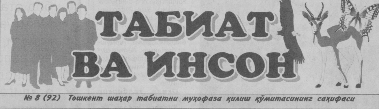
№ 8 (92) Тошкент шаҳар табиатни муҳофаза қилиш қўмитасининг саҳифаси

Собир МАҲАМАТОВ, Тошкент шаҳар табиатни муҳофаза қилиш қўмитаси нозир.