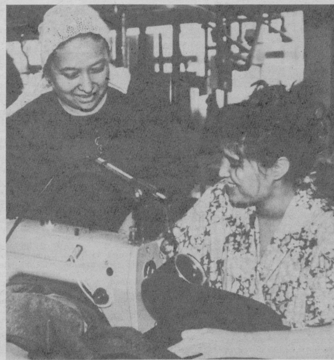
Бичиш-тикиш ишига қадим-қадимдан хотин-қизлар меҳр қўйиб келишган. Хозирда ҳам у аёлларимиз учун кадрли касб ҳисобланади.