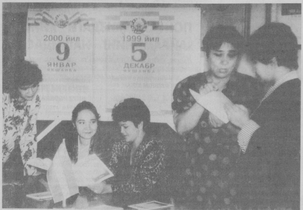
Собир Раҳимов туманидаги 165-мактабда Чукурсой сайлов округига қарашли 231-сайлов участкаси ташкил этилган.