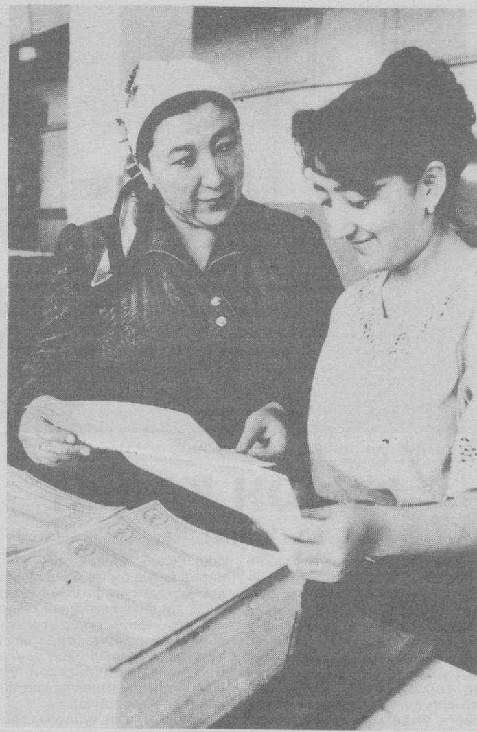
Хунарнинг таги зар. Бири устоз, бири шогирд.

Турғун ФАЙЗИЕВ тайёрлаган. (Давоми бор).