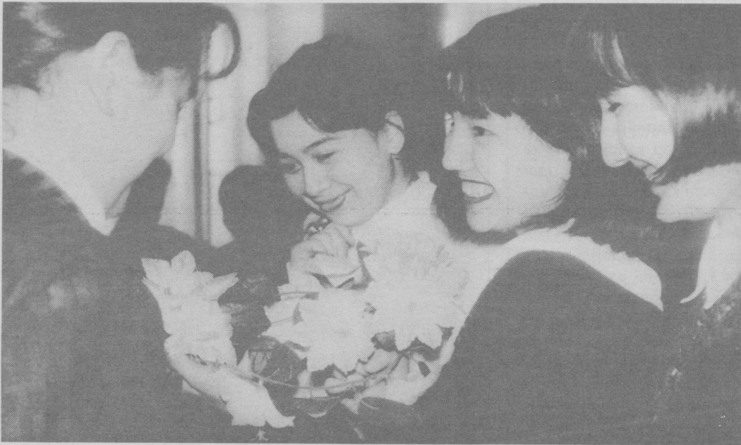
Чехрангиздан табассум аримасин.