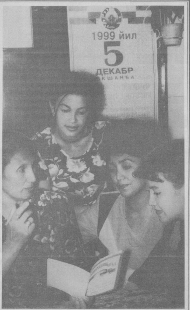
Шаҳримиздаги 63-ўрта мактабда 565-сайлов участкаси ташкил этилиб, у сайловларга тайёргарлик ишларини қизғин бошлаб юборди.

Марказ бунинг учун мустақил номзодларга фуқаролар ташаббускор гуруҳларини тузишида ва уларнинг сайлав комиссиялари томонидан рўйхатга олинишида қўмаклашади, сайловларда мустақил номзодларнинг умумий рўйхатини тузишда, уларга сайловолди кампаниясини ўтказишда, хусусан, мустақил номзодларни қўллаб-қувватлаш учун имзо тўплашларида, учрашувлар ва ташвиқот ишларини олиб боришларида ёрдам беради, мустақил номзодларнинг кузатувилашлари излаб топши, жалб қилиш ва тайинлашда ҳуқуқий, маънавий қўмаклашади. Бундан ташқари биз мустақил номзодларга Ўзбекистон Республикаси қонунчилигига мувофиқ уларнинг сайлов ҳуқуқлари, ушбу ҳуқуқларини амалга ошириш воситалари ва усуллари тўғрисида тавсиялар берамиз, мустақил номзодларнинг сайлов ҳуқуқлари бузилган тақдирда уларнинг ҳуқуқларини таъминлашга қўмаклашамиз ва манфаатларини ҳимоя қиламиз, фуқаролар, давлат ва жамбат ташкилотлари, хорижий давлатлар ва халқор ташкилотлар вакилларига сайловларда да иштирок этаётган мустақил номзодлар тўғрисида мунтазам маълумотлар бериб берамиз. Яъни, биз халқ ичидан кўрсатилган мустақил номзодларнинг тенг рақобат