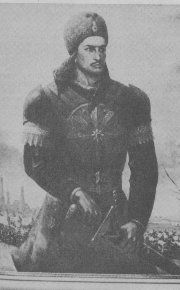
Хоразмшоҳ эл-Арслон (1159—1172) вафотидан сўнг тоғу тахт учун ўзаро кураш бошланиб кетади. Ниҳоят, 1172 йили эл-Арслоннинг катта ўғли Текешхон Қора Хитойлар ёрдамида тахтни эгаллайди.

Бу қадимий ва табаррук тупроқдан буюк алломалар, фозилу фузалолар, олим уламолар, сиёсатчилар, саркардалар етишиб чиққан. Ислом КАРИМОВ