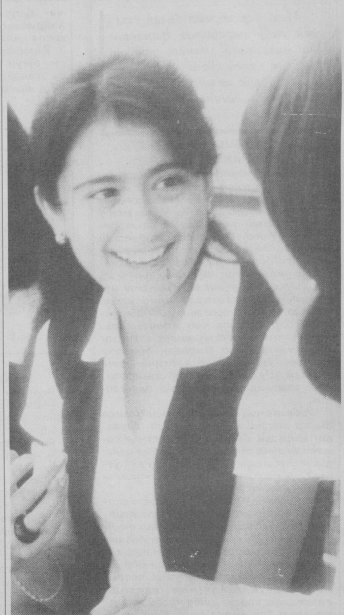
Болаликнинг қувноқ онлари. Равиль Альбеков олган сурат-лавҳаси.