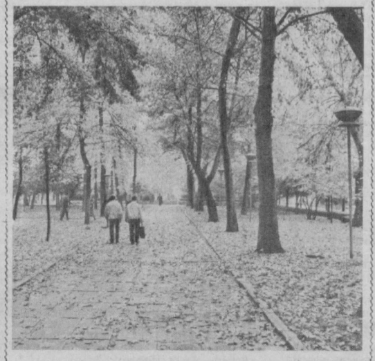
Серқуён ўлкасида ҳамон олтин куз ҳўкмонлики қилмоқда.

КУМУШСИМОН булутлар аксарият аини тонг ғира-шира ёришайтган вақтда ва осмон жуда тиниқ пайтида пайдо бўлади. Бироқ улар табиатнинг ҳозиргача ечимланган жумбоқларидан биридир.