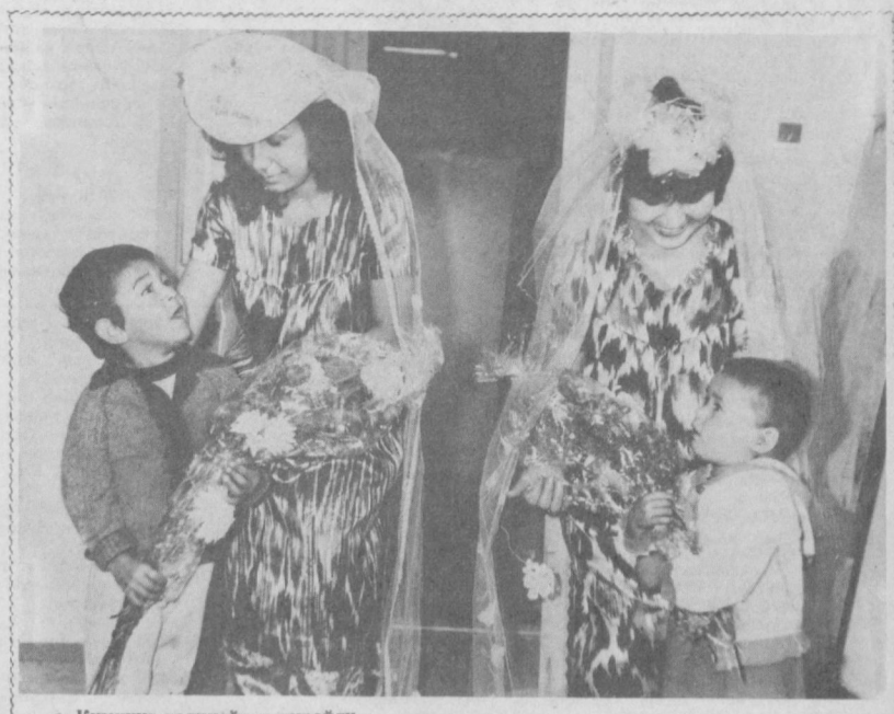
Кимнинг келиноиси чиройли.