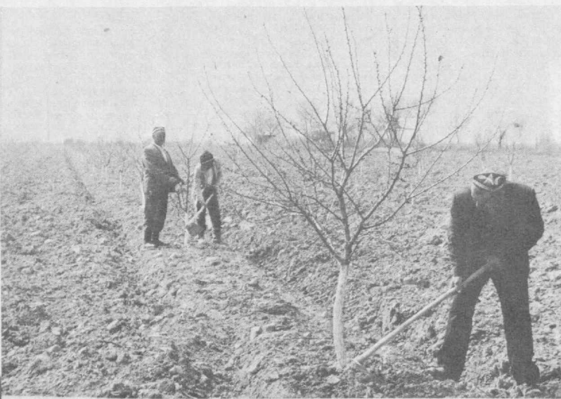
«Яхшидан боғ қолади».

Боғ ва тоқзорларда мўл сифатли ҳосил етиштириш учун баҳорда ерин ишлаш, ўғитлаш, касаллик ва зараркундаларга қарши курашиш, дарактларнинг орғичча ва қуриган шохларини кирчиштириш, шакл беришга алоҳида эътиборни қаратиш даркор. Жорий кўлмак бирмунча серёғин келмоқда. Натигада айрим юмушларни вақтида ўтказиш имкони бўлмаётир. Шу кунларда мевазорлар шатор оралари кузда шулорланмаган ва ўғитланмаган бўлса, тезда кераклик миқдорда маҳаллий ва минерал ўғитларни солиб, ерин 30—35 сантиметр чуқурликда сифатли ҳайдаш даркор. Хосилдорлигига қараб, боғнинг ҳар гектарига 120—180 килограмм азот, 60—90 килограмм фосфор, 30—45 килограмм калий берилади. Серёғон тоқзорларнинг ҳар гектарига эса 120—180 килограмм азот, 90—100 килограмм фосфор, 45—60 килограмм калий сепилади. Агар минерал ва маҳаллий ўғитлар аралаш ҳолда тулроққа солинса самарадорлик ортади, заминдаги турли кичик ҳужайралар ҳаракати фаоллашади. Гектарига ўртача 10—20 тоннадан гўнг қўшиб берган маъқул. Ўғитларни тулроқ остига чуқурроқ солиш ер қатламларида кўпроқ нам тўплашга йўмаклашади, заминнинг биологик ҳусусиятини оширади. Илгизга яқин қилиб берилган ўғитлардан дарахт ва тоқлар тўлиқ фойдаланади, оқибатда хосилдорлиги 20—40 фоз ортади. Маҳаллий ўғит тушган ерда ҳосил миқдори кўпайиши билан бирга мевалар дондор, бир текис етилади, бир йиллик новдалар яқин бўлади.