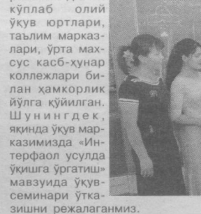
роларимизнинг меҳнат бозоридан эркин рақобатга киришишларини таъминлашдек, эзгу мақсадни кўзлаб ахил жамоамиз доимо изланишда.

Марказимизда баъзи имкониятлар чекланганлиги боис бугун кунда шахримиздаги давлат таълим муассасалари ҳамда Халқаро «Олтин мерос» жамғармасининг Тошкент шаҳар бўлиmlига қарашли Абулқосим мадрасасининг қўли гул хунарманд усталари «Уста-шоғирд» йўналишида йил охиригача 100 нафар