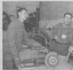
ларни касбга тайёрлаш, қайта ўқитиш ва малакасини ошириш борасида услубий ва техникавий ҳамкорлик тўғрисида шартнома тузилган. Бу ҳамкорлик ҳам албатта ўқиш самарадорлигини оширишда муносиб ҳисса қўймоқда.

қилиш, ривожлантириш ҳамда унинг бебаҳо, умрбоқий анъаналарини давом эттириш мақсадида ўшбу эзгу ишлар амалга оширилмоқда.