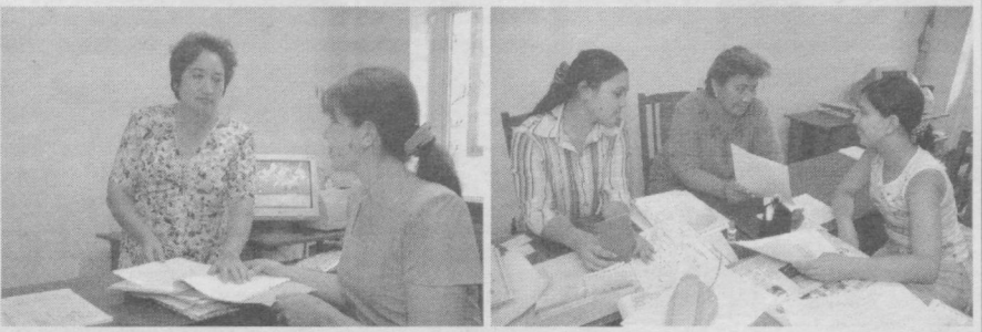
Тошкент шаҳар ҳокимлигининг Меҳнат, аҳолини иш билан таъминлаш ва ижтимоий ҳимоялаш бош бошқармасига қарашли туман меҳнат бўлиmlарида айни ёз мавсумида ишлар қизгин кечади. Биз Учтепа туман меҳнат бўлимида жорий йилда амалга оширилган ишлар билан қизиқдик.

Алоҳида ҳолларда турар жойни яшаш учун мўлжалланмаган жойга ўтказиш мулкдорнинг ёхуд у ваколат берган орган (шахс)нинг аризасига кўра Ўзбекистон Республикаси Уй-жой кодексининг 15-моддасига биноан Қорақалпоғистон Республикаси Вазирлар Кенгаши, вилоятлар ва Тошкент шаҳар ҳокимликларининг қарорига кўра Ўзбекистон Республикаси Вазирлар Маҳкамаси томонидан белгиланган тартибда амалга оширилади.