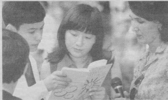
«Китоб — оғтоб» деб бежизга айтилмаган. Уни ўқиган сари яна ўқигинг, ташналигингни қондиргинг келаверади.