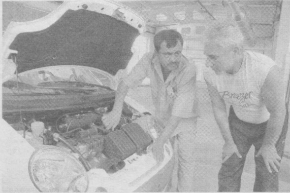
Механик кўрик — 2005

Шайхонтоҳур тумани ҳокимлиги қoшидаги «AVTOTO'HOVTEXHIZMAT» бошқармаси Шайхонтоҳур тумани ҳокимлиги қoшидаги «SHAYXONTOHUR INVEST» Давлат унитар корхонасига қўшиб юборилганлиги сабабли «SHAYXONTOHUR INVEST» Давлат унитар корхонасига «AVTOTO'HOVTEXHIZMAT» бошқармасининг ҳуқуқий вoрисига ҳисобланади ва унинг барча ҳуқуқ ва мажбуриятлари бўйича жавобгардир. Телефон: 41-01-50.