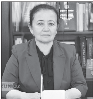
Эльмира Баситханова, Ўзбекистон Республикаси Соғлиқни сақлаш вазири ўринбосари:

– Республика Перинатал, скрининг марказлари, туғуқ мажмуалари, бирламчи тизимда фаолият кўрсатаётган “Аёллар маслаҳатхонаси” маҳалланинг тиббий бригадалари, акушер-ги-