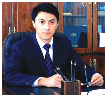
Амрилло Иноятов, Ўзбекистон Республикаси Соғлиқни сақлаш вазири- нинг биринчи ўринбосари:

Жорий йилнинг 25 май куни Ўзбекистон Республикаси Президентининг “Соғлиқни сақлаш соҳасини комплекс ривожлантиришга доир қўшимча чора-тадбирлар тўғрисида”-ги қарори қабул қилинди. Мазкур қарор бўйича Соғлиқни сақлаш вазири ўринбосарларининг муносабати: