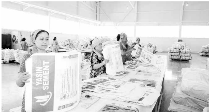
Суратда: Сирдарё вилоятидаги “Sirdaryo Mega Luks” масъулияти чекланган жамияти шаклидаги қўшма корхонасида.

Айни пайтда корхонада 1 600 киши меҳнат қилмоқда. 2023 йилга қадар маҳсулот тури ва ишлаб чиқариш ҳажмининг кенгайтирилиши ҳисобига ишчилар сони 6 000 гага етказилиши мўлжалланган.