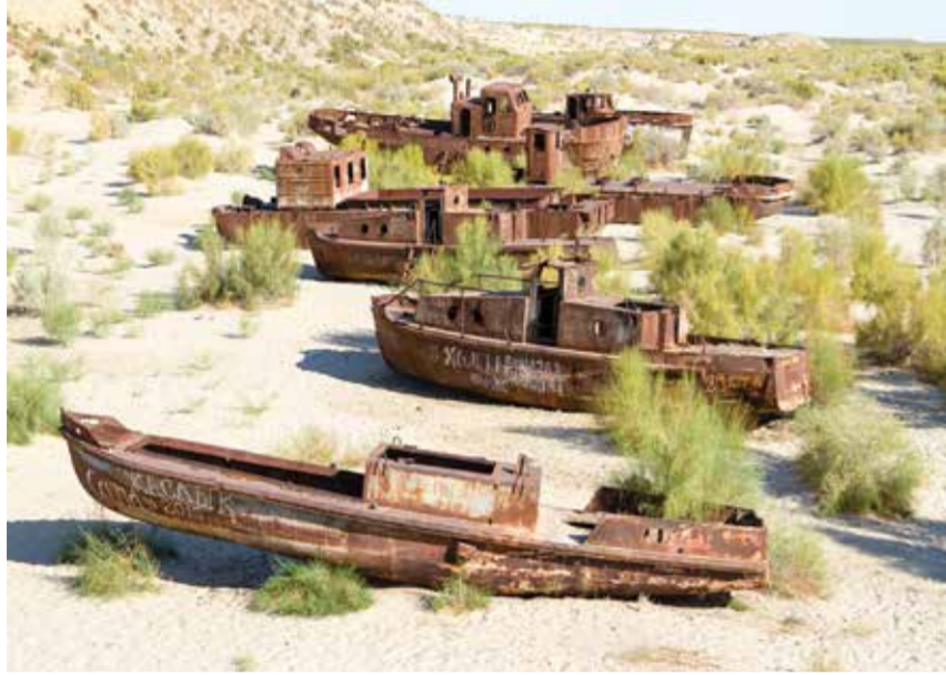
Марат УЛПЕТОВ, "O'zbekiston bunyodkori" мухбири.

БМТ Бош Ассамблеясининг Оролбўйи ҳудудини экологик инновация ва технологиялар зонаси деб эълон қилиш тўғрисидаги резолюциясига Корея Республикасининг элчиси Кан Чжэ Квон ўз муносабатини билдириб, Оролбўйи ҳудудини қўтқариш лойиҳаларига 7 миллион долларга яқин маблағ ажратаётгани тўғрисида маълум қилди.