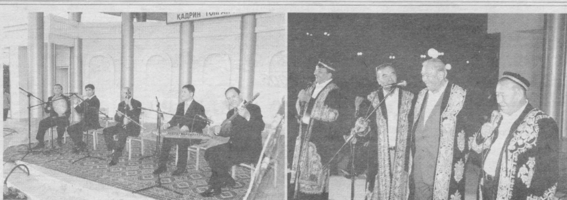
Шаҳримиз дам олиш таскалларига