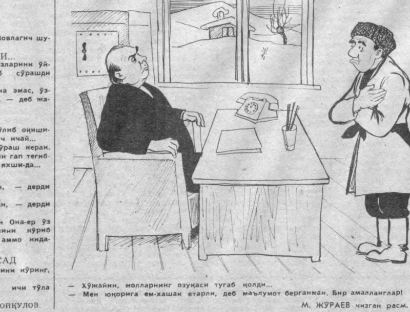
— Хўжайин, молларнинг озуқаси тугаб қолди... — Мен юқорига ем-хашак етарли, деб маълумот берганман. Бир амалланглр!