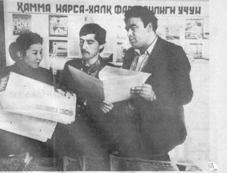
ҲАММА НАРСА-ҲАҚ ҚОШИЛИГИ УЧУН

Ҳар бир участкада сайловчилар билан мулоқотлар бўлиб боради. Сайловчилар билан мулоқотлар бўлиб боради. Сайловчилар билан мулоқотлар бўлиб боради.