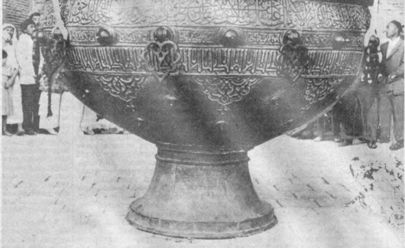
Билиб қўйган яхши