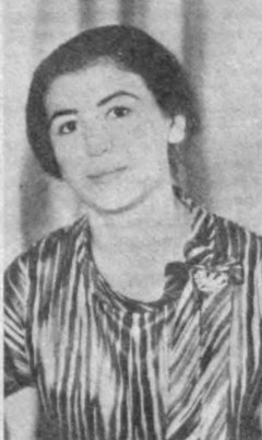
гатлари учун ўтказилган семинарда қатнашганман.