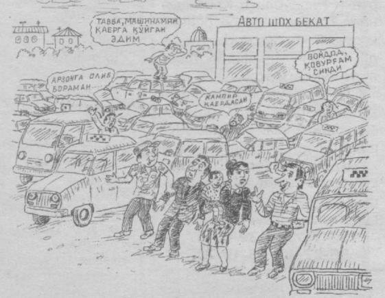
Абдурасул Ҳақимов чизган расм.

сида эса ҳеч нарса бўлмайди, қуруқ туради... — Қуруқ ховуз нега керак, — ҳайрон бўлиб сўради муҳандис. — Дўстларим орасида сузишни билмайдиганлари ҳам бор, нодон, — жавоб берди бойвачча.