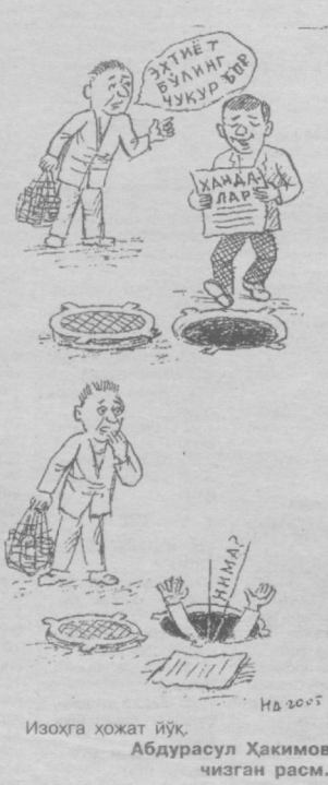
Изоҳга хожат йўқ. Абдурашул Ҳақимов чизган расм.