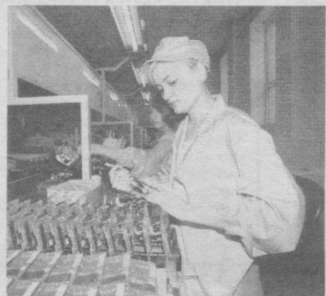
тажрибасига ишончини билдиради десак муболаға қилмаган бўламыз.

Маълумки, «Holley Group CO LTD» корпорацияси Хитойдаги етакчи илмий ишлаб чиқариш компанияларидан саналади. Ушбу компаниянинг айти дамада АКШ, Канада, Нидерландия, Таиланд, Исроил, Аргентина ва шу каби бошқа бир қатор давлатларда филиаллари бор. Ушбу компаниянинг юртимизда ҳам ўз филиалини оғанлиги бизнинг мутахассислар