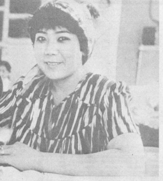
Очиқ чеҳрали бу қиз Жинах устки трикотаж буюмлари ишлаб чиқариш фабрикасининг Дўстлиқ ноҳиясидаги «Октябрь 50 йиллиги» совхозида фаолият кўрсатаётган филиалида меҳнат қилди.

шукки, истеъдодли режиссёр Ибодулла Ёшмаатов театрдаги кучлар бошани бирктириб, уларнинг диққат-этиборини ижодий масалаларга қаратишга муваффақ бўлган. Аксарият актёрлар бош режиссёрнинг йўлини қўллаб-қувватлашмоқда. «Лайли ва Мажнун», «Олма пишганда келинга», «Жаҳаннама», «Олтин балик» спектакллари мана шундай ҳам-жиҳатлик, барқарорлик маъсули сифатида дунёга келди. Хоразм театри томошбинларини бетараф қолдирмайди, гоҳ қулдиради, гоҳ йиғлатади, ларазга солади. «Лайли ва Мажнун» спектакли бобоқалониямиз Алишер Навоий юбилейига ахши соғаб бўлди. Спектаклга Навоий қиёфаси олиб қирилган. Нуруний шоир муҳаббат фожиясини ҳимоя қилиш билан спектаклни бошлайди ва воқеаларга яқин ясайди.