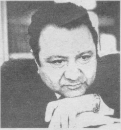
Жуманиёз ЖАББОРОВ, Ўзбекистон халқ шоири

ЎЗБЕКИСТОН НАВОЛАРИ Бағри дарё, феълга дунё, эли барпо— Гулшаним бор, Ўзбекистон азиз номи.