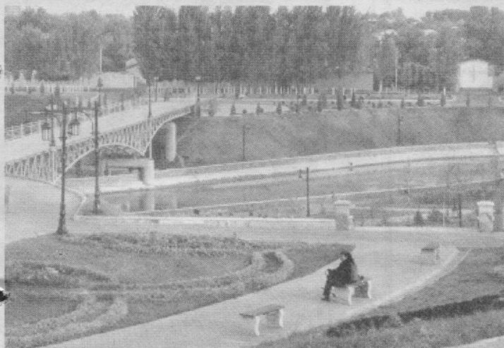
Шаҳримизнинг гўзал манзараси.