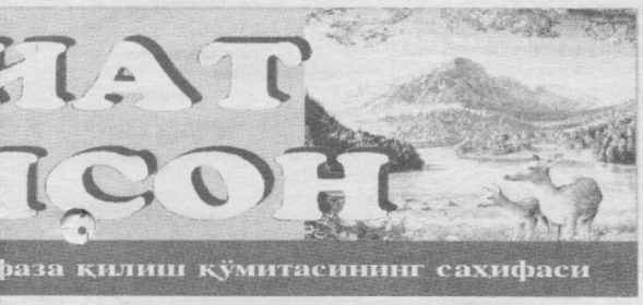
№10 (162) Тошкент шаҳар табиати муҳофаза қилиш кўмитасининг саҳифаси

Атроф-муҳитни муҳофаза қилиш, экологик вазиятни соғломлаштириш бориб, уни ўз ҳолатида сақлаб туриш инсоният олдидан турган долзарб муаммолардан бири. Чунки табиатнинг бебаҳо манбааларидан паллартиқ фойдаланиш, унга нисбатан қўриқол, ваҳшийларча муносабатда бўлиш ер кўрасида экологик мувозаннинг бузилишига олиб келаётганлиги ва натижада, ўтилмаган тўқ оқатлар келиб чиқётганлиги ҳеч кимга сир эмас. Бугунги кунда мамлакатимизда атроф-муҳитни муҳофаза қилиш ва табиий манбалардан оқилона фойдаланиш давлат сибасати даражасига кўтарилишининг боиси ҳам ана шунда.