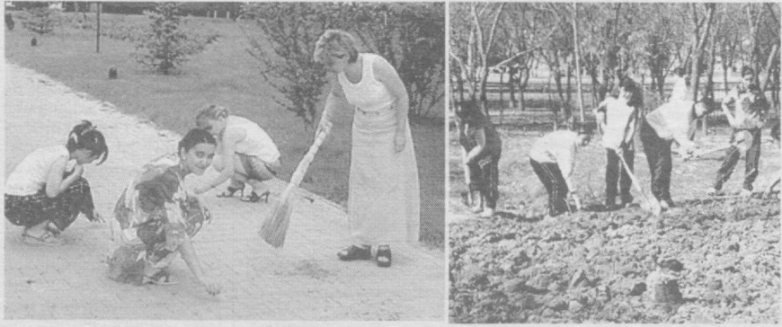
Орасталик ва тозалик — ён-атрофга нурафшонлик, кўнгилларга эса хушнудлик бахш этади.

Хаммага маълумки, инсон овқат-сиз-50 кун, сувсиз-5 кун, ҳавосиз эса 5 дақиқачагина яшай олади. Олимлар шунинг тасдиқлашдики, биз нафас олаётган ҳавонинг тозалиги санитар қоидаларига тўри жавоб берса, унда инсон ҳозирги яшаётган муҳитдан янада узоқроқ умр кўриши мумкин экан. Сув — бу инсониятга табиат томонидан берилган ҳаёт манбаи, бебаҳо неъмат, бойлиги ва инъомидир. Сув ҳаётнинг туғилишида, об-ҳаво ва иқлим ўзгаришида, инсон саломатлигини сақлашда асосий роль ўйнайди.