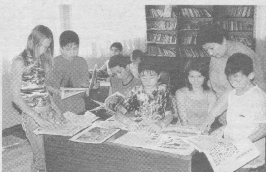
Китоб — билим манбаи, ҳаёт сарчашмаси. Ўқиб, изланмоқ эса, ёрқин келажакка йўлланмадир.