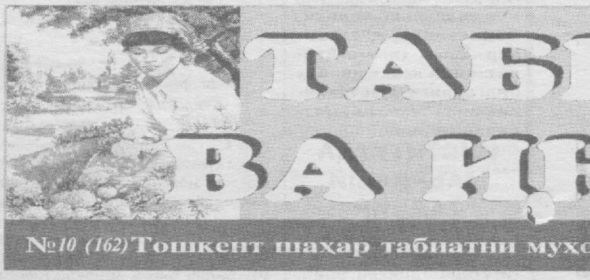
№10 (162) Тошкент шаҳар табиати муҳофаза қилиш кўмитасининг саҳифаси

Атроф-муҳитни муҳофаза қилиш, экологик вазиятни соғломлаштириш бориб, уни ўз ҳолатида сақлаб туриш инсоният олдидан турган долзарб муаммолардан бири. Чунки табиатнинг бебаҳо манбааларидан паллартиқ фойдаланиш, унга нисбатан қўриқол, ваҳшийларча муносабатда бўлиш ер кўрасида экологик мувозаннинг бузилишига олиб келаётганлиги ва натижада, ўтилмаган тўқ оқатлар келиб чиқётганлиги ҳеч кимга сир эмас. Бугунги кунда мамлакатимизда атроф-муҳитни муҳофаза қилиш ва табиий манбалардан оқилона фойдаланиш давлат сибасати даражасига кўтарилишининг боиси ҳам ана шунда.