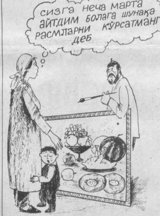
М. УНГАРОВ чизган расм.

С. РАСУЛОВ, Ойимқишлоқ уруш ва меҳнат фахрийлари Кенгаши раиси.