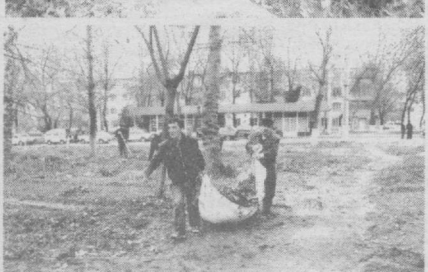
Муҳаббат ҲАБИБУЛЛАЕВА СУРАТЛАРДА: ҳамшаҳарларимиз кузги хазонрезги юмушларини бажаришда фаоллик кўрсатишмоқда.