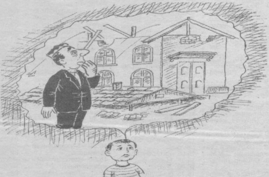
Катталар гапи Миттвой тасавурида.

— Бу аниқ! Бундай фильмлар кўлингда фожиали якун топади! Элдорбек АКРОМОВ тайёрлади.