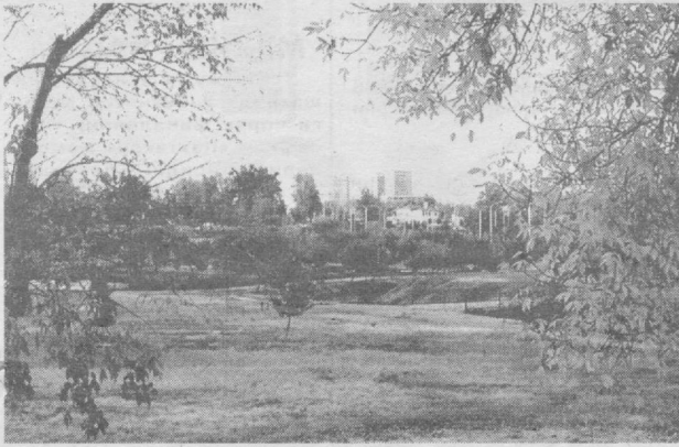
Куз фасли шаҳримиз кўркіга ўзгача файз бағишлайди.