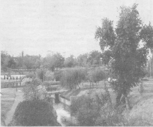
Кузнинг ҳар бир лаҳзаси гўзал.