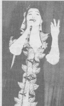
Осиё ва жаҳон халқлари мусиқа ижодиёти ва тарихи, мероси ва ижрочилик масалаларига бағишланган. Фақатгина мустақиллик даврида профессор-ўқитувчиларимизнинг муаллифлигида 80 дан зиёд илмий тадқиқотлар, дарсликлар, ўқув қўлланма ҳамда нота тўпламлари нашр юзини кўрди.