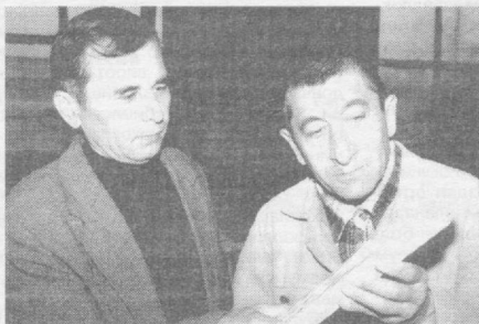
«Тошкентмебель» корхонасида ишлаб чиқарилаётган маҳсулотларнинг сифати ва турлари ортиб бормоқда.

Тошкент шаҳар ҳокимлиги Матбуот хизмати ва ўз мухбирларимиз хабарларидан.