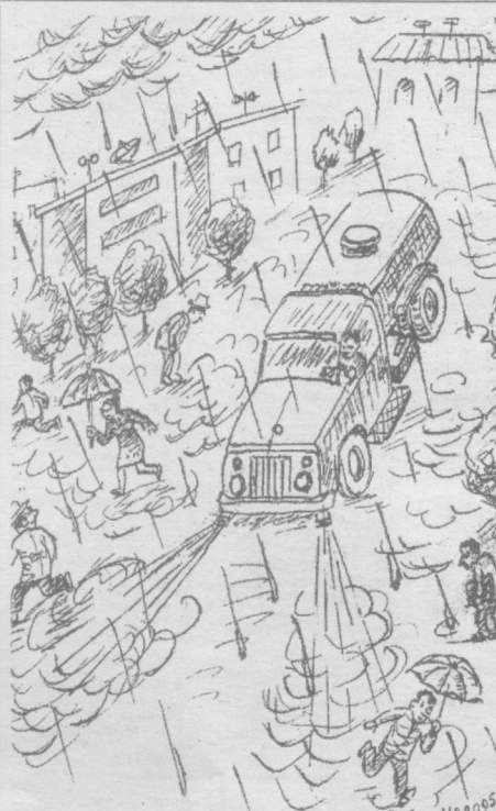
Изоҳга ҳожат йўқ.