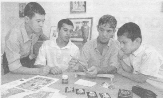
Шаҳримиздаги Болалар ижодиёти уйи қисқа муддат ичида фарзандларимизнинг севимли масканига айланди. Бу марказда 10 хил йўналишдаги 20 та клуб, студия ва тўғараклар мавжуд. Жорий йилнинг 15 сентябрендан ўз фаолиятини бошлаган ижодиёт уйи доимо болалар билан гавжум.

СУРАТЛАРДА: Болалар ижодиёти уйи фаолиятдан лавҳалар.