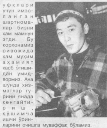
СУРАТЛАРДА: қўшма корхона ишчи-хизматчиларининг меҳнат фаолиятини даволати.

—Албатта, хизмат кўрсатиш сифатини ошириш, буюртмачи талабини кўнгилдагидай бажариш учун етарли эҳтиёт қисмлар кераклиги ўз-ўзидан аён,—дейди корхона директори.—Айтиб ўтиш керак, бу борада бизда айрим муаммолар ҳам бўлиб туради, негаки контрабанда йўли билан олиб келинаётган ана шундай эҳтиёт қисмлар нисбатан арзонроқ-да. Яна шу нарсани алоҳида таъкидлаш ўринлики, Президентимизнинг Россияга ташрифи ва ушбу давлат билан ҳамкорликнинг янги