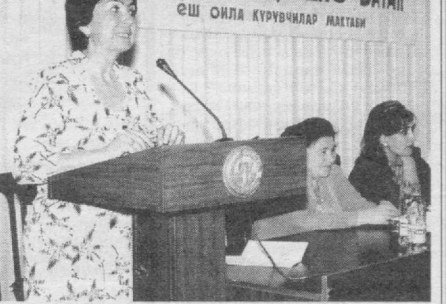
ОИЛА - МУҚАДДАС ВАТАН ЕШ ОИЛА ҚУРУВЧИЛАР МАКТАБИ

Таъкидлаш жоизки, мактабининг асосий мақсади оила қурувчи ёшларнинг сиёсий, ҳуқуқий, ижтимоий-иқтисодий ва тиббий-савоҳдонлигини оширишдан иборат. Ёшларга