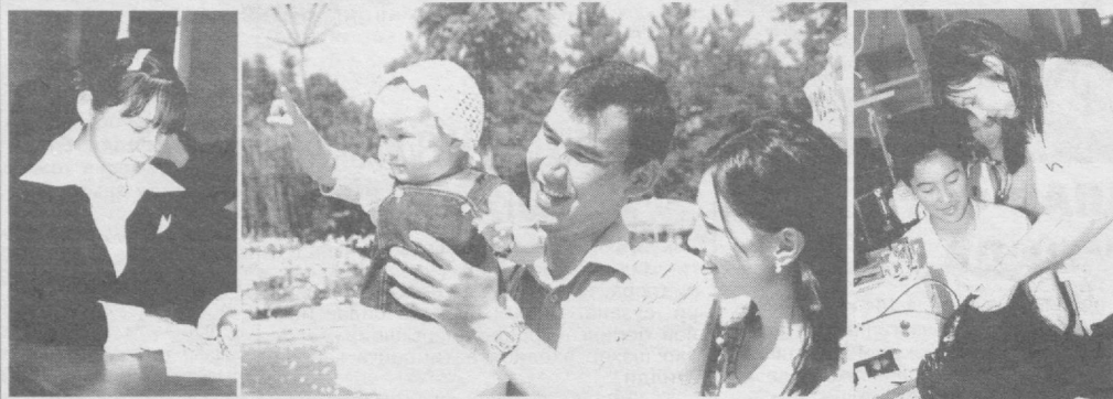
41-модда. Хар ким билим олиш ҳуқуқига эга. Бел-пул умумий таълим олиш давлат томонидан кафолатланади. Мактаб ишлари давлат назоратидадир.