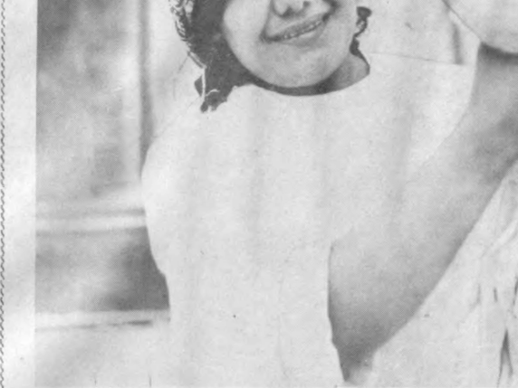
Риштон районидagi Навбахор посёлка-сида жойлашган 3-парандачилик фаб-рикаси коллективни Озёқ-овқат програм-маси ижросига муносиб улуш қўшмоқ-да. Ўтган йили парандабоқарлар план-даги 650 тонна ўрнига 680 тонна пар-ҳез гўшт сотдилар. Улар ўн иккинчи беш йиллиқнинг якуловчи йилида ютуқ-