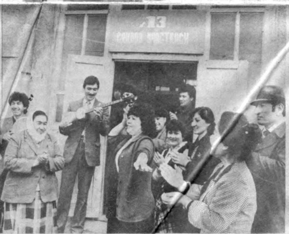
Бир неча ой кизгин тортишувлар, эди. Мухим сиёсий ташаббуслар ва қишлоқлар аҳолиси ўлкадаги ишларни ортида қолди. Халқнинг бурдек фаол қатнаши. Сиз кўриб ўзининг аёл фарзандларига юксак ишонч билдириб, гражданлик бурчларини адо қилган институтда жойлашган 8-сайлов участкаси, Ташкент районидagi «Делини уюл» колхоз меҳнатқилларига ҳамда сўртбунлар шаҳарчаси сайловчиларини кўриб турибсиз.