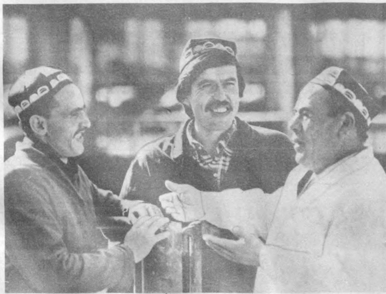
Республикамизда чорвачиликни пухта йўлга қўйган бақувват хўжаликлар қаторида Сирдарё районидаги «Малик» совхози алоҳида ўрин тутди. Сермеҳнат юмушларни механизациялаш, тармоққа интенсив усулларини жорий этиш борасида зарбдор соҳа жонқурлари янгидан-янги ютуқларни қўлга киритишапти.

Айни пайтда Тожикистон ва Туркменистон матлубот кооперациясининг вакиллари ҳам биз билан учрашув учун Тошкентга келишди.